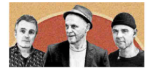
Blues Max Trio.