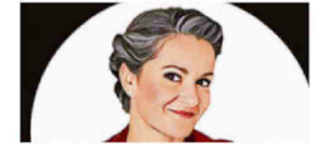
Frölein Da Capo.