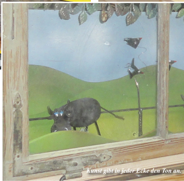
Kunst gibt in jeder Ecke den Ton an.