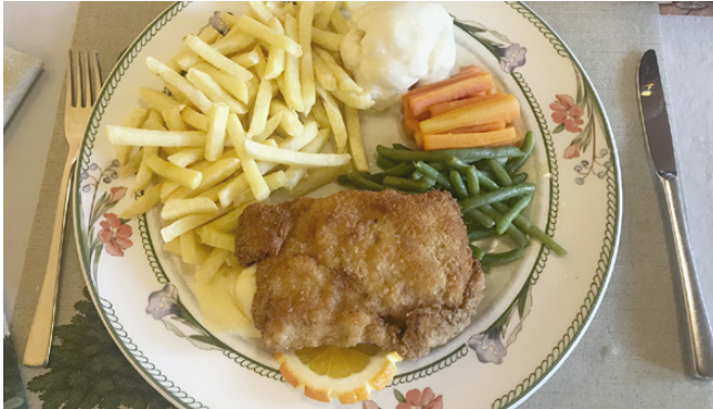
Das letzte Cordon bleu im Freihof.

Ein Dankesbrief ans Team des Freihofs, das nun in den Ruhestand getreten ist.