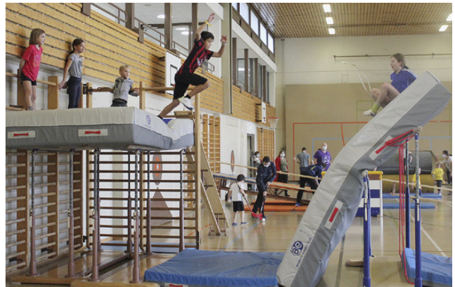
Mut ist zwischendurch auch mal gefragt: Abenteuer Turnhalle.

Damit alle ihre Freiräume nutzen können, haben die Organisatoren die Zeit von 9.30 bis 11.30 Uhr vor allem für die kleineren Kinder reserviert, die in der Regel in Begleitung eines Elternteils kommen. Von