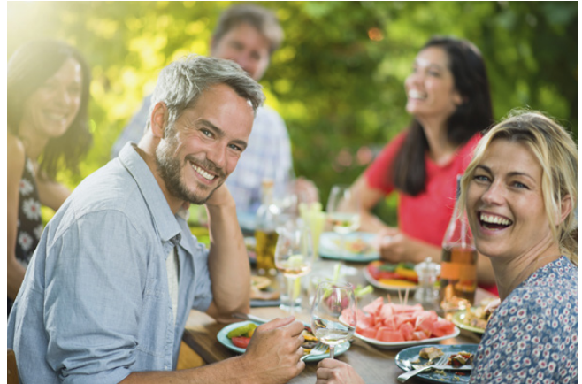
Gesundes Essen ist Grundlage für allgemeines Wohlbefinden.

Spektrum «Mein Stoffwechselltyp» Mo, 31. Januar, 19 Uhr Ref. Kirchgemeindehaus Dietlikon