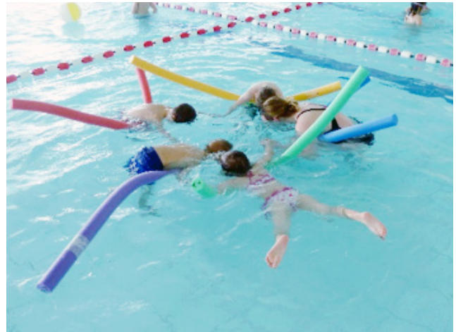
Ihr aqua-life Team